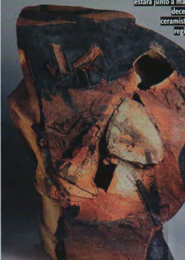
Ruth Krauskop Taller Huara H estará junto a má dece ceramist regi